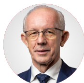
GEN. WIESŁAW LEŚNIAKIEWICZ Wiceminister Spraw Wewnętrznych i Administracji

Projekt ustawy o ochronie ludności i obronie cywilnej ma na celu zasklepienie luki prawnej, która powstała w tym zakresie po wejściu w życie Ustawy o obronie Ojczyzny . Zakłada on systemowe podejście do zapewnienia bezpieczeństwa mieszkańców. Precyzuje także zadania poszczególnych organów administracji publicznej, przede wszystkim w wymiarze praktycznym. Za jakie obszary będą odpowiadać przedstawiciele poszczególnych szczebli samorządu terytorialnego, a za jakie administracji rządowej? Jakie wyzwania stoją przed organami i podmiotami ochrony ludności? Jak skutecznie zabezpieczyć obywateli przez zagrożeniem? Jak zwiększyć ich świadomość w tym zakresie?